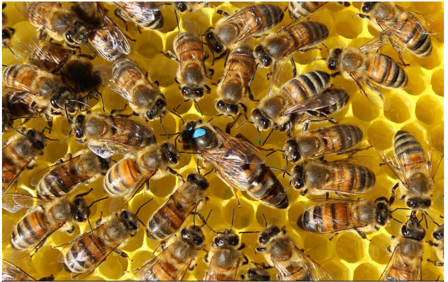
Farvemærket (blå) dronning.